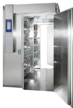
イリノックス MF大型シリーズ 【プラスチック&ショックフリーザー】