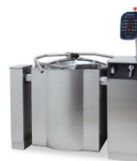
メトス Proveno-200E 【自動攪拌ケトル】