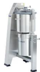
ロボクーブ R-45/CL-52 【大型カッターミキサー】 【野菜スライサー】